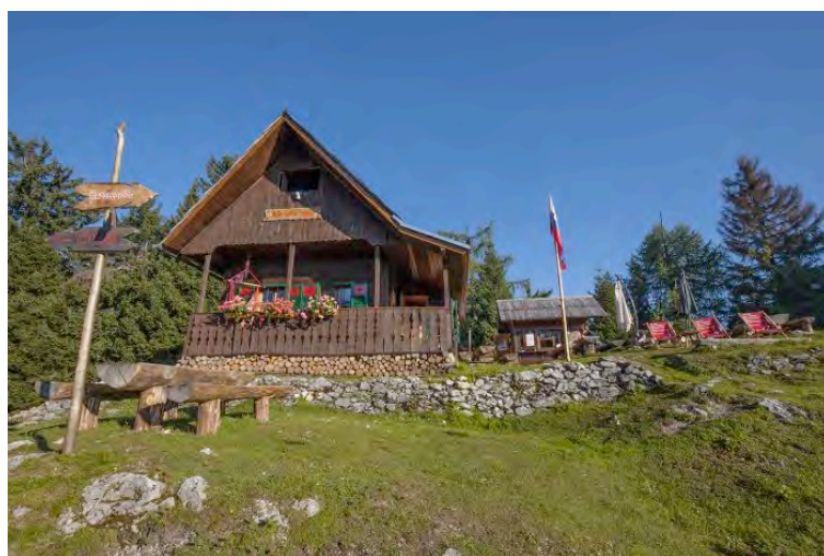
Mojčin dom na Vitrancu